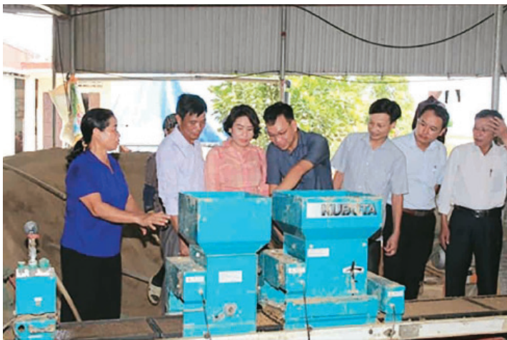
Mô hình dân vận khéo "Vận động nguồn lực xây dựng nông thôn mới" của Ban Công tác Mặt trận thôn Xuân Chiếng, xã Ngũ Phúc