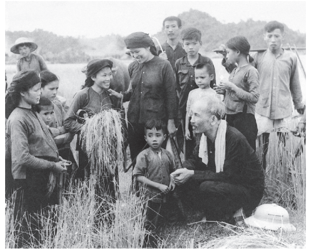
Gắn bó mật thiết với Nhân dân- phong cách dân vận gần gũi của Bác Hồ là bài học còn nguyên giá trị trong thời đại ngày nay

Thứ ba , công tác dân vận phải đảm bảo thực hành dân chủ rộng rãi, thực chất, lấy đoàn kết trong Đảng làm hạt nhân, mở rộng dân chủ trên mọi lĩnh vực của đời sống xã hội theo phương châm “dân biết, dân bàn, dân làm, dân kiểm tra”, phát huy ý thức làm chủ của Nhân dân, chủ động, tự giác, hăng hái, sáng tạo, góp trí lực, vật lực, cùng cấp ủy, chính quyền vượt