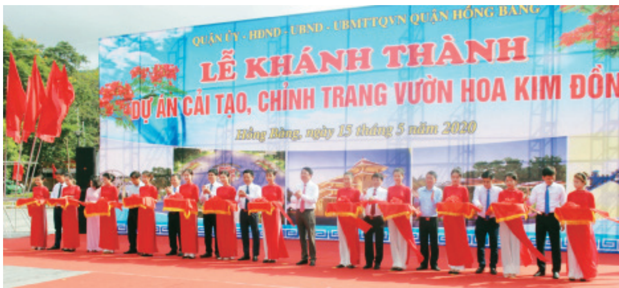
Lễ khánh thành dự án cải tạo, chỉnh trang vườn hoa Kim Đồng

Quận Hồng Bàng đang chuyển mình mạnh mẽ với sự phát triển nhanh về mọi mặt, trong đó sự phát triển đột phá về hệ thống hạ tầng đô thị, nhiều dự án, công trình hạ tầng trọng điểm được đầu tư xây dựng với quy mô lớn, góp phần quan trọng thúc đẩy kinh tế- xã hội phát triển, nâng cao chất lượng cuộc sống của người dân; vệ sinh môi trường và cảnh quan đô thị từng bước hiện đại.