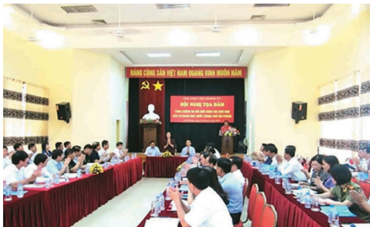
Hội nghị tọa đàm “Tăng cường và đổi mới công tác dân vận của cơ quan nhà nước thành phố Hải Phòng”

nhiệm vụ quốc phòng, an ninh, trật tự an toàn xã hội bằng nhiều hình thức, nội dung phù hợp; tăng cường đi cơ sở, gắn bó với Nhân dân, nắm chắc địa bàn, nhất là những địa bàn trọng điểm, phức tạp về an ninh chính trị, nơi có khiếu kiện, tố cáo đông người, tiềm ẩn mâu thuẫn phát sinh thành điểm nóng ( Bộ đội biên phòng Hải Phòng đã phân công 165 cán bộ, đảng viên phụ trách 748 hộ gia đình ở khu vực biên giới; Công an thành phố bố trí, sắp xếp 70 công an chính quy công tác tại 21 xã thuộc 6 huyện ). Tổ chức nhiều hoạt động hỗ trợ, giúp đỡ, thăm hỏi, tặng quà