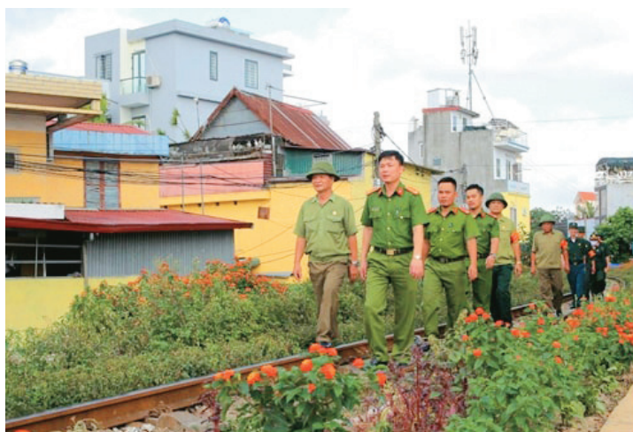
Mô hình “Liên kết phòng chống tội phạm, tệ nạn ma túy và cải tạo vệ sinh môi trường khu vực đường sắt quận Lê Chân” của Công an quận Lê Chân

Một là , để thực hiện mô hình bền vững phải là một quá trình lâu dài, đòi hỏi sự kiên trì và đặc biệt phải thường xuyên làm tốt công tác dân vận xây dựng quần chúng nòng cốt trong phong trào “Toàn dân bảo vệ an ninh tổ quốc”. Công an quận cần tiếp tục thực hiện có hiệu quả Chỉ thị số 09/CT-BCA-V28 ngày 01/11/2016 của Bộ trưởng Bộ Công an về tăng cường công tác dân vận của lực lượng Công an nhân dân trong tình hình mới gắn với thực hiện Nghị quyết 09/CP và Chương trình quốc gia phòng chống tội phạm, Chương trình quốc gia phòng chống ma túy, Chương trình mục tiêu quốc gia giảm nghèo bền vững và các phong trào thi đua khác của