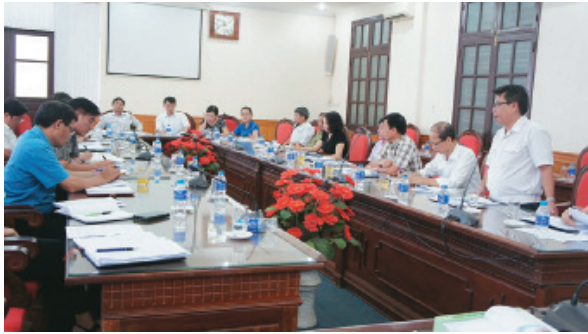
Đoàn Công tác của Ủy ban MTTQ Việt Nam thành phố giám sát tại huyện Thủy Nguyên