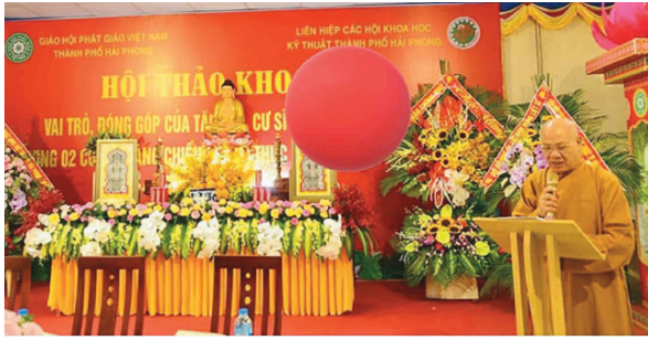
Hội thảo khoa học vai trò đóng góp của tăng ni, cư sĩ Phật giáo Hải Phòng trong hai cuộc kháng chiến chống thực dân Pháp và đế quốc Mỹ

giáo, quận, huyện (trừ huyện đảo Bạch Long Vỹ); có 618 ngôi chùa do Thành hội quản lý, trong đó có 353 ngôi chùa có sư trụ trì và kiêm nhiệm trụ trì; có 430 tăng, ni và hơn 35 vạn Phật tử. Hàng Giáo phẩm: 02 Hòa thượng, 11 Thượng tọa, 05 Ni trưởng và 36 Ni sư. Công tác giáo dục đào tạo tăng tài luôn được Giáo hội đặc biệt quan tâm đào tạo tăng, ni có trình độ học vấn cao, có trình độ Phật pháp, văn hóa để kế thừa, phát huy truyền thống “ Truyền đăng, tục diêm ”. Những năm qua, Giáo hội Phật giáo thành phố có nhiều tăng, ni có trình độ Phật học và thế học, có đạo hạnh, năng lực đáp ứng nhu cầu công tác Phật sự của Giáo hội. Đến nay, Giáo hội Phật giáo thành phố có 02 vị là tiến sĩ, 32 vị đang theo học tại Học viện Phật giáo; 60 vị đang học Trung cấp Phật học, nhiều vị có trình độ thạc sĩ, hàng trăm vị có trình độ cử nhân Phật học. Nhiều vị có phẩm trật cao, trở thành lãnh đạo Trung ương Giáo hội Phật giáo Việt Nam và thành phố.