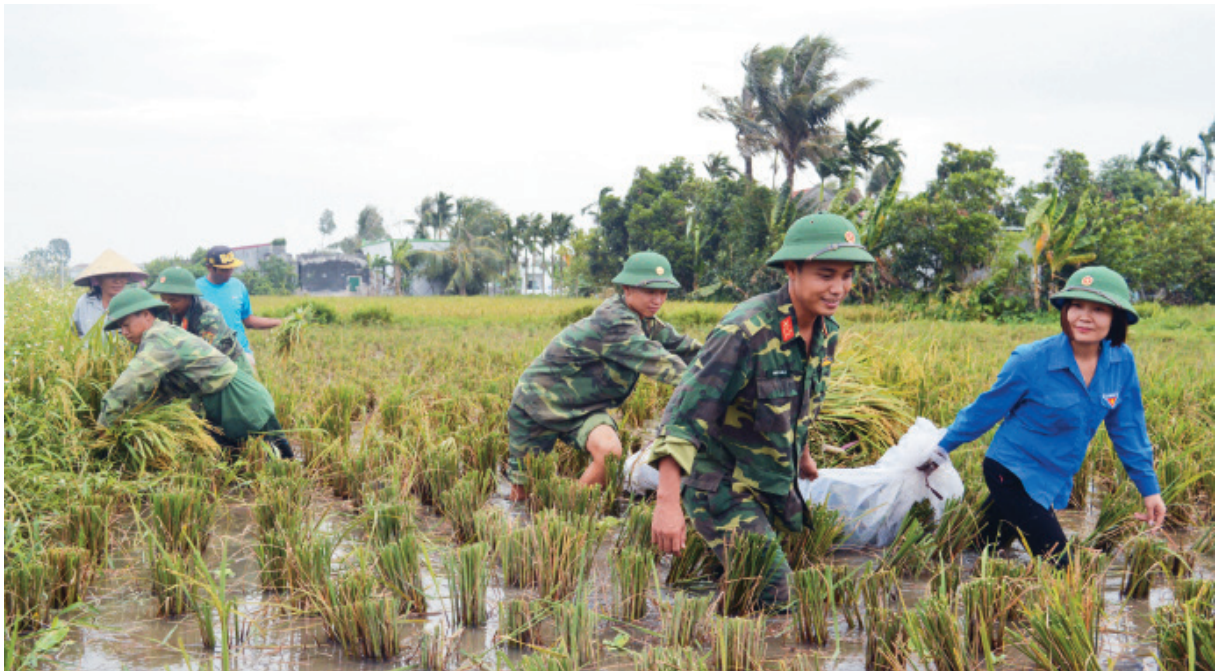
Cán bộ, chiến sỹ giúp dân thu hoạch lúa

Với những kết quả đạt được, thời gian tới lực lượng vũ trang thành phố Hải Phòng tiếp tục quán triệt sâu sắc đường lối, quan điểm của Đảng, phát huy phẩm chất, truyền thống Bộ đội Cụ Hồ, truyền thống “ Trung dũng - Quyết thắng ”, không ngừng đổi mới, nâng cao chất lượng, hiệu quả công tác dân vận nói chung và phong trào thi đua “ Dân vận khéo ”, xây dựng “ Đơn vị dân vận tốt ” nói riêng, củng cố mối đoàn kết máu thịt quân - dân, xây dựng thế trận lòng dân vững chắc, góp phần hoàn thành xuất sắc mọi nhiệm vụ được giao./.