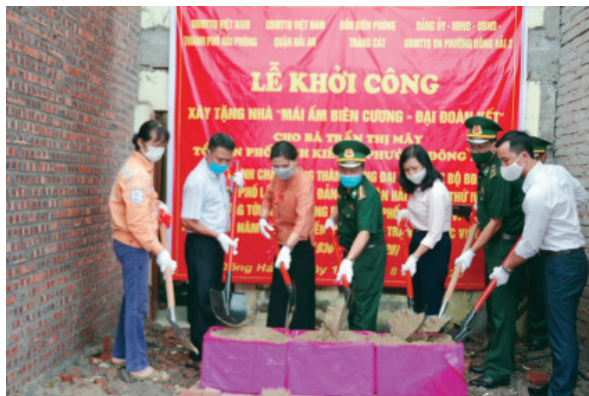
Bộ đội Biên phòng thành phố phối hợp với Ủy ban MTTQ thành phố và quận Hải An khởi công xây nhà cho gia đình có hoàn cảnh khó khăn tại phường Đông Hải 2

Ba là , thường xuyên bám sát nhiệm vụ chính trị của địa phương, phối hợp chủ động nắm chắc tình hình nhân dân, tình hình địa bàn; theo dõi, nắm tâm tư, nguyện vọng của Nhân dân để có