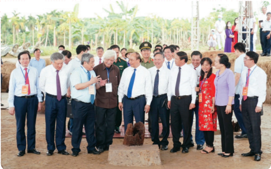
Đồng chí Nguyễn Xuân Phúc, Ủy viên Bộ Chính trị, Thủ tướng Chính phủ cùng các đồng chí lãnh đạo thành phố Hải Phòng tham quan Khu Bảo tồn Bãi cọc Cao Quý, tại xã Liên Khê, huyện Thủy Nguyên