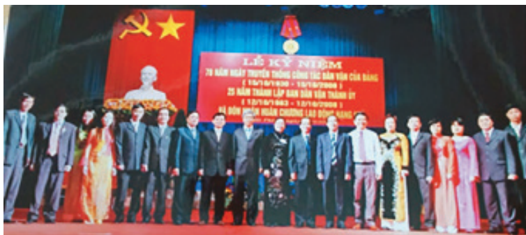
Kỷ niệm 75 năm Ngày Truyền thống công tác dân vận của Đảng, 25 năm Ngày thành lập Ban Dân vận Thành ủy

Dân vận Thành ủy đã lựa chọn 500 mô hình “Dân vận khéo” đại diện cho các lĩnh vực hoạt động của đời sống xã hội để tôn vinh, khen thưởng tại Hội nghị tổng kết, biểu dương khen thưởng năm 2008, được Thành ủy và Ban Dân vận Trung ương ghi nhận, đánh giá cao và khẳng định chủ thể làm lên mô hình “Dân vận khéo” trước hết phải xuất phát từ trách nhiệm, tâm huyết trong việc giải quyết hài hòa mối quan hệ giữa Nhà nước- tập thể và cá nhân, luôn nhận thức sâu sắc tư tưởng Hồ Chí Minh “việc có lợi cho dân thì nên làm, việc có hại cho dân phải nên tránh”. Sau việc tổng kết thực tiễn xây dựng mô hình “Dân vận khéo” cần có cách làm sáng tạo hơn, đảm bảo tính bền vững, lan tỏa, phù hợp trên tất cả các lĩnh vực công tác dân vận theo quy trình: “Thực tiễn sinh động- Chủ trương sát hợp- Biện pháp linh hoạt- Nhân dân đồng thuận- Biểu dương kịp thời- Tổng kết nhân rộng”.