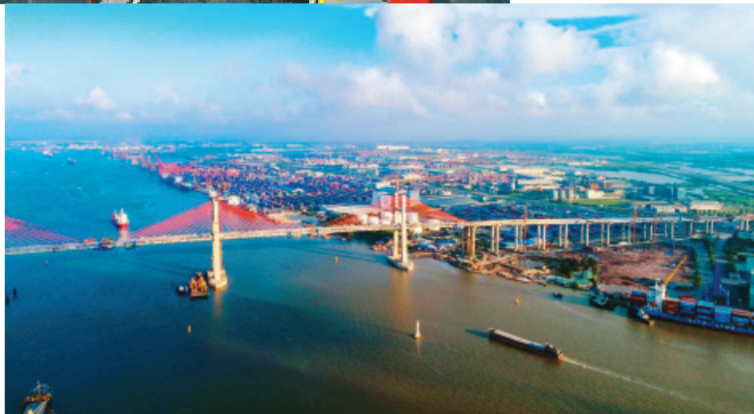
Cầu Bạch Đằng, góp phần thúc đẩy phát triển kinh tế mạnh mẽ cho thành phố Hải Phòng và tỉnh Quảng Ninh