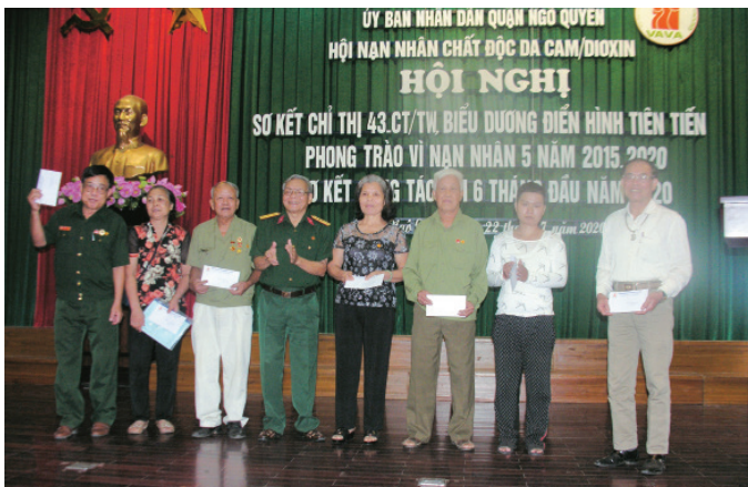
Hội nghị biểu dương điển hình tiên tiến trong Phong trào vì nạn nhân da cam/dioxin 5 năm 2015 - 2020