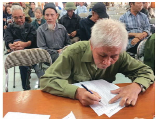
Công tác tổ chức trao tặng quà của thành phố tại điểm xã Đông Thái, huyện An Dương, Hải Phòng

Các hoạt động thăm, tặng quà đối tượng chính sách nhân dịp các ngày Lễ, Tết với mức quà tặng năm sau cao hơn năm trước, thuộc nhóm đầu của cả nước. Năm 2016, tặng quà 146,12 tỷ đồng; năm 2017, tặng quà 243,089 tỷ đồng; năm 2018, tặng quà 328,565 tỷ đồng; năm 2019, tặng quà 358,992 tỷ đồng; năm 2020, dự kiến trên 400 tỷ đồng. Điều vui mừng, phấn khởi đó là mức hỗ trợ vật chất đối với các gia đình