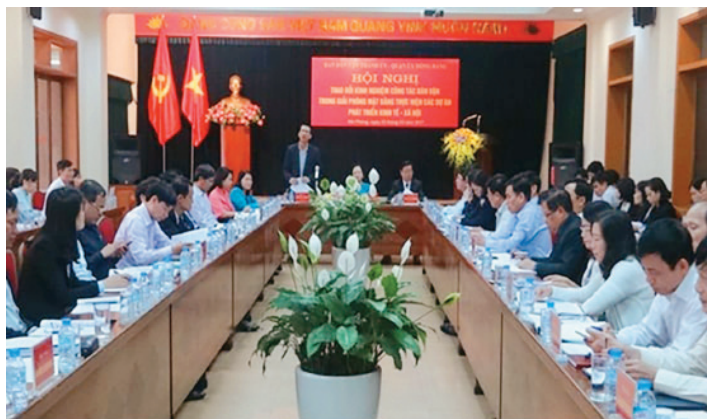
Hội nghị trao đổi kinh nghiệm công tác dân vận trong công tác giải phóng mặt bằng thực hiện các dự án phát triển kinh tế-xã hội

Kết quả công tác dân vận tham gia giải phóng mặt bằng đã góp phần đẩy nhanh tiến độ các dự án phát triển kinh tế-xã hội trên địa bàn, từng bước xây dựng kết cấu hạ tầng giao thông đồng bộ, hiện đại, thay đổi diện mạo nông thôn, chỉnh trang đô thị, thúc đẩy kinh tế thành phố phát triển nhanh, đột phá trên nhiều lĩnh vực, xây dựng hình ảnh thành phố Hải Phòng năng động, phát triển, là điểm đến tin cậy, thành công của các nhà đầu tư ( từ năm 2008 đến hết năm 2019, toàn thành phố đã triển khai quyết định thu hồi đất với 733 dự án, tổng diện tích phải thu hồi 13.066,3ha, số hộ gia đình, cá nhân có đất bị thu hồi là 98.325 hộ, 612 tổ chức, đã phê duyệt bồi thường cho 91.891 hộ, đạt 93%; số hộ gia đình phải bố trí tái định cư là 16.283 hộ, đã bố trí 10.451 hộ, đạt 64%. Số dự án đã hoàn thành giải phóng mặt bằng là 528 dự án, đạt 71% ).