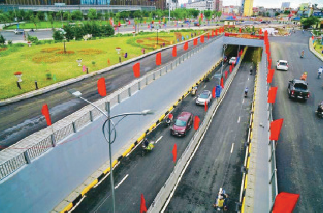
Dự án đầu tư xây dựng Nút giao Nam cầu Bính - Điểm nhấn giao thông đồng bộ và hiện đại tại cửa ngõ phía Tây Bắc của thành phố Hải Phòng