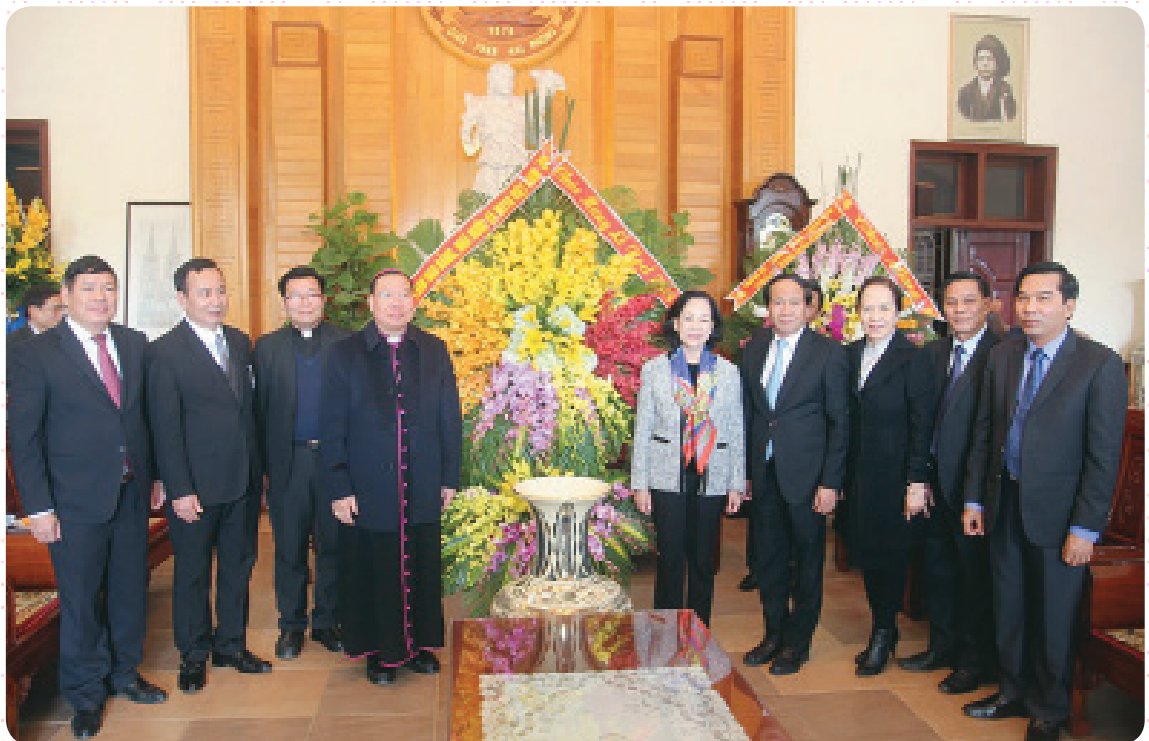
Đồng chí Trương Thị Mai, Ủy viên Bộ Chính trị, Bí thư Trung ương Đảng, Trưởng Ban Dân vận Trung ương và các đồng chí lãnh đạo thành phố chúc mừng tại Tòa giám mục giáo phận Hải Phòng nhân dịp Noel