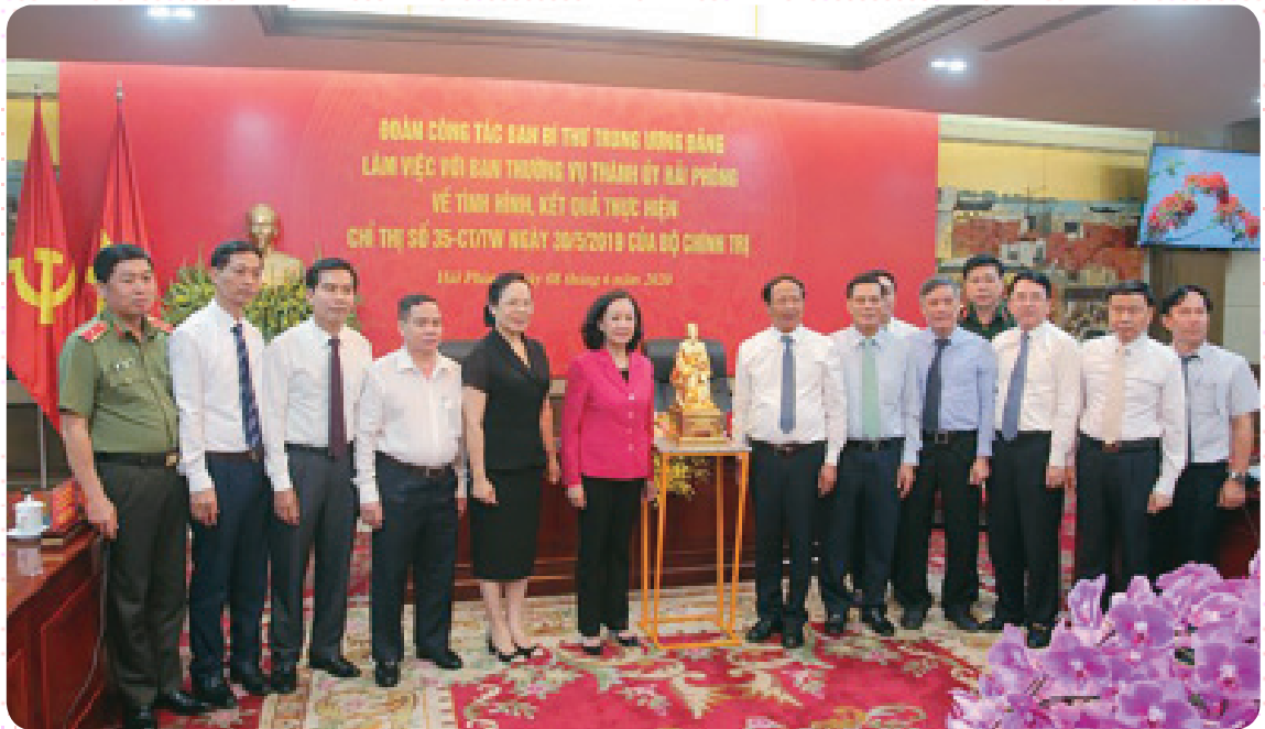
Đồng chí Trương Thị Mai, Ủy viên Bộ Chính trị, Bí thư Trung ương Đảng, Trưởng ban Dân vận Trung ương làm việc với Ban Thường vụ Thành ủy Hải Phòng về tình hình kết quả thực hiện Chỉ thị 35-CT/TW ngày 30/5/2019 của Bộ Chính trị