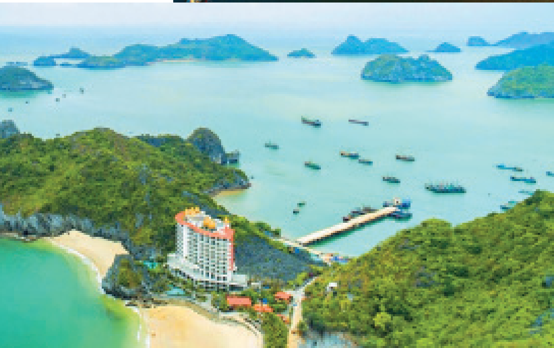
M'gallery - Khách sạn năm sao tại Cát Bà.