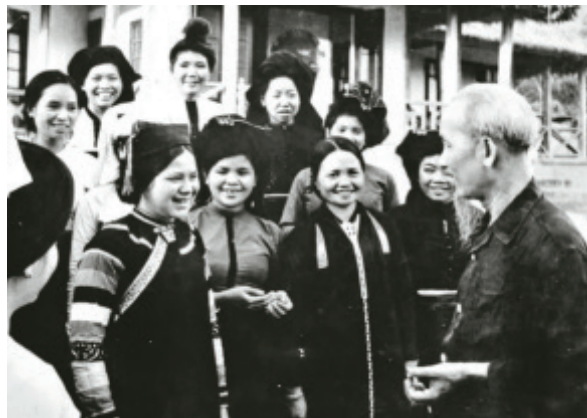
Chủ tịch Hồ Chí Minh luôn coi dân vận và công tác dân vận là nhiệm vụ có ý nghĩa chiến lược đối với sự nghiệp cách mạng

Sau cao trào cách mạng 1930-1931, phong trào đấu tranh đòi dân sinh, dân chủ 1936 - 1939, phong trào Phản đế 1939 - 1941 và phong trào Mặt trận Việt Minh 1941-1945, với chủ trương mở rộng chính sách đại đoàn kết toàn dân và công tác mặt trận, Đảng đã tập hợp đông đảo các tầng lớp nhân dân, các hình thức đấu tranh công khai, hợp pháp, nửa hợp pháp đã tạo nên bước phát triển mới trong xây dựng lực lượng chính trị quần chúng. Dưới sự lãnh đạo của Đảng, sự tham