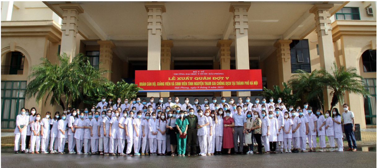
Lễ xuất quân đợt 5 của Đoàn cán bộ, giảng viên và sinh viên Trường Đại học Y Dược Hải Phòng tình nguyện tham gia phòng, chống dịch tại thành phố Hà Nội

“ Mỗi người dân là một chiến sĩ ” đã từng trở thành khẩu hiệu trong suy nghĩ và hành động của các thế hệ người Việt Nam trong các cuộc kháng chiến chống giặc ngoại xâm để giành lại độc lập và bảo vệ Tổ quốc. Và hôm nay, khi đất nước chúng ta phải chiến đấu với “ kẻ thù đặc biệt ” rất nguy hiểm giấu mặt, liên tục biến hóa và tàng hình là đại dịch Covid-19 với sự xuất hiện của các biến chủng mới, có khả năng lây lan nhanh, nguy hiểm, tiếp tục diễn biến phức tạp ở nhiều địa phương, đặt ra thách thức lớn cho chúng ta trong thực hiện “mục tiêu kép”, vừa phòng, chống dịch, vừa phát triển kinh tế - xã hội.