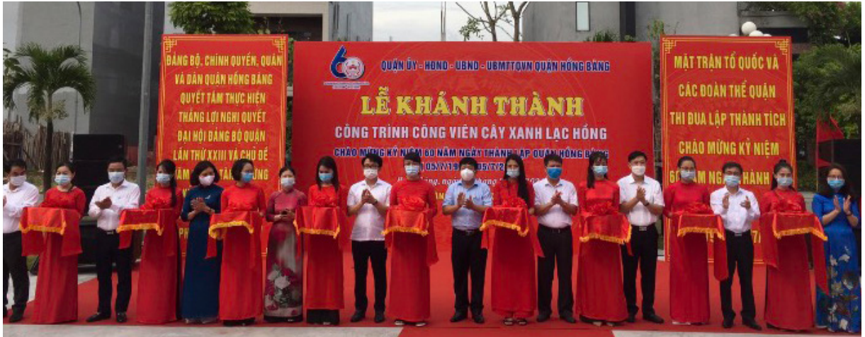
Lễ khánh hành công trình công viên cây xanh Lạc Hồng, quận Hồng Bàng