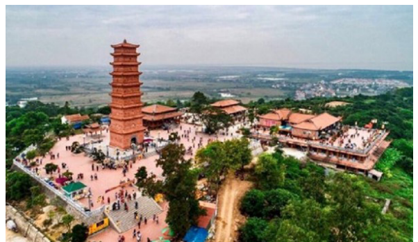
Tháp Tường Long

gia tu hành nên có danh xưng Ni để gọi người nữ xuất gia, thành từ ghép: Tăng, Ni. Phật giáo ở Việt Nam, tất cả những người xuất gia tu hành còn có danh xưng là Sư - theo nghĩa là Thầy trên nhiều phương diện. Người xuất gia tu hành của Phật giáo có những bậc khác nhau: người mới vào tu gọi là Tiểu (hay Điều), người thụ (nhận) 10 giới gọi là Sa-di, người thụ đầy đủ các giới (Cụ túc giới) theo quy định (250 giới với tăng, 348 giới với Ni) gọi là Tỷ kheo (hay Đại đức). Những Tỷ kheo (hay Tỷ khưu) có đủ tuổi đời, tuổi tu theo quy định gọi được suy tôn phẩm Thượng tọa (45 tuổi đời, 20 tuổi tu - đi hạ), Hòa thượng (60 tuổi đời, 40 tuổi tu - đi hạ). Với Ni gọi là Ni sư (tương đương với Thượng tọa), Ni trưởng (tương đương với Hòa thượng).