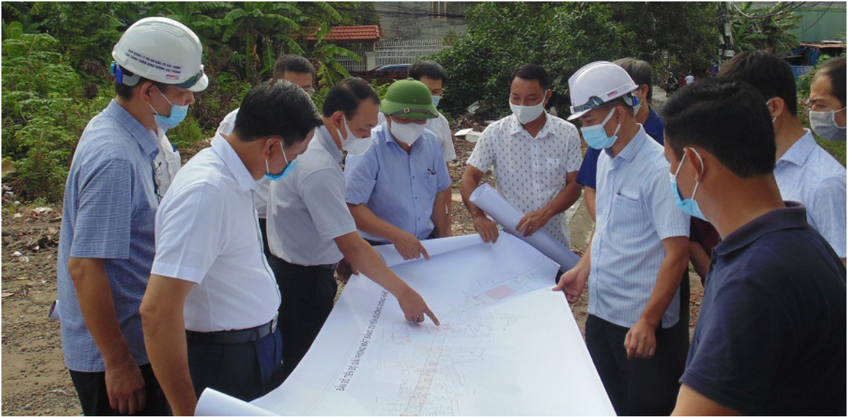
Đồng chí Nguyễn Đức Thọ, Phó Chủ tịch Ủy ban nhân dân thành phố kiểm tra tiến độ Dự án Đông Khê 2

dấu ấn rất đậm nét sự lãnh đạo của Ban Thường vụ Thành ủy trong công tác thu hút đầu tư, giải phóng mặt bằng triển khai các dự phát triển kinh tế-xã hội trên địa bàn. Ý chí và hành động của Ban Thường vụ Thành ủy đã thực sự lan tỏa tới các cấp ủy trực thuộc, trong đó có Quận ủy Ngô Quyền.