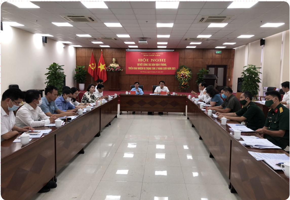
Hội nghị sơ kết công tác dân vận 9 tháng, triển khai nhiệm vụ trọng tâm 3 tháng cuối năm 2021