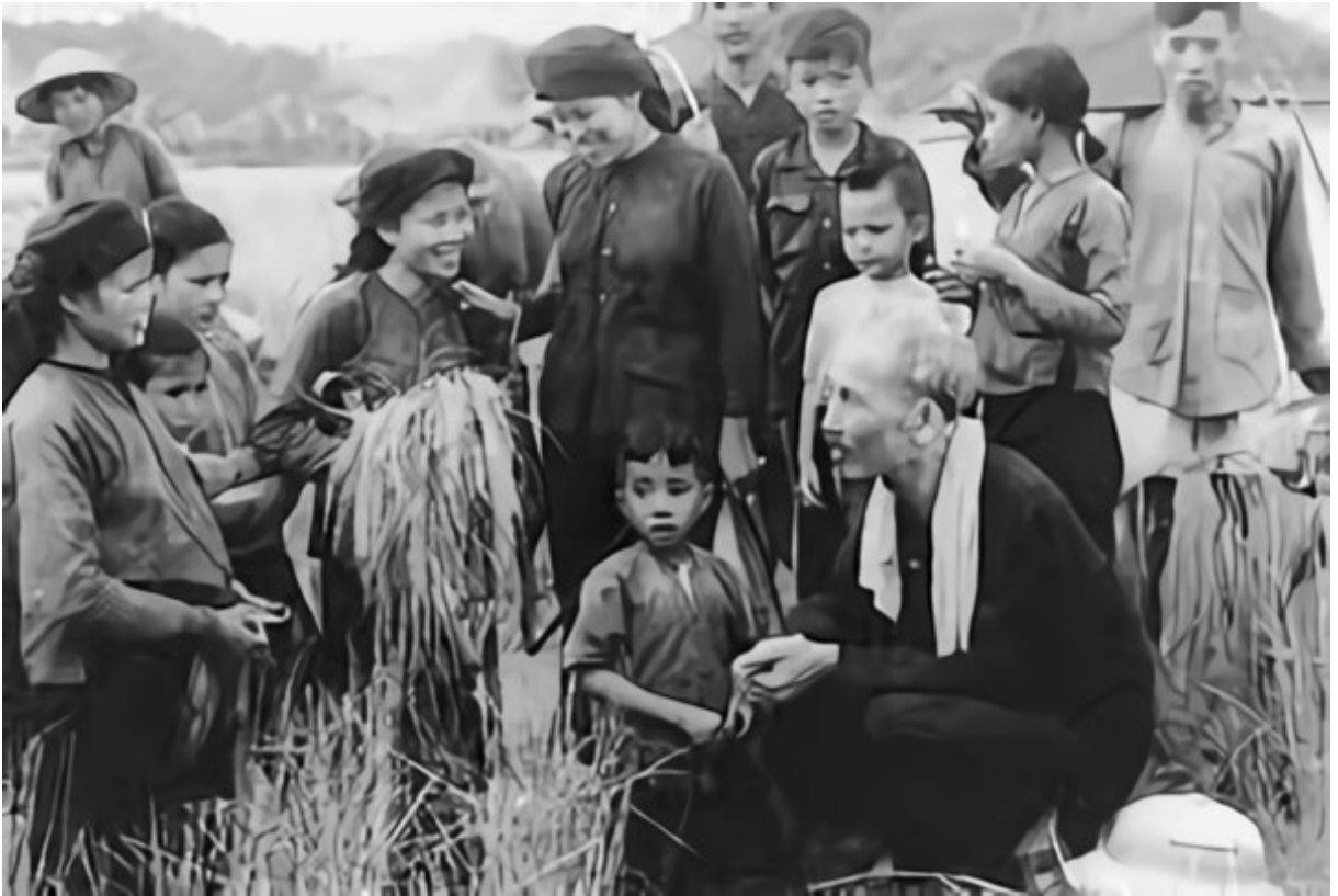
Bác Hồ với Nhân dân

công tác dân vận đã vận động toàn quân, toàn dân quyết tâm chiến đấu, lao động, sản xuất, đồng thời, tăng cường công tác địch vận, làm tan rã hàng ngũ nguy quân, nguy quyền, chống địch lập tề; động viên thanh niên viết đơn xung phong ra chiến trường, hàng chục ngàn dân công đi tiền tuyến vận tải lương thực, thực phẩm, vũ khí phục vụ các chiến dịch, cao điểm là thắng lợi chiến dịch Điện Biên Phủ tạo nên sức mạnh, tiền đề vững chắc để kế thừa, phát huy trong các giai đoạn cách mạng tiếp theo.