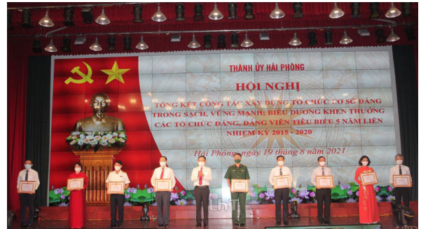
Đồng chí Trần Lưu Quang, Bí thư Thành ủy trao Cờ và Bằng khen cho các đảng bộ

Sáng ngày 19/8/2021, Ban Thường vụ Thành ủy tổ chức Hội nghị trực tuyến tổng kết công tác xây dựng tổ chức cơ sở Đảng trong sạch, vững mạnh; biểu dương, khen thưởng các tổ chức đảng, đảng viên tiêu biểu 5 năm liền, nhiệm kỳ 2015 - 2020. Đồng chí Trần Lưu Quang, Ủy viên Trung ương Đảng, Bí thư Thành ủy, Trưởng Đoàn đại biểu Quốc hội thành phố Hải Phòng chủ trì Hội nghị. Phát biểu tại Hội nghị, đồng chí Bí thư Thành ủy nêu rõ: Với tinh thần phát huy truyền thống “Trung dũng - Quyết thắng”, 5 năm qua, Đảng bộ, chính quyền và Nhân dân thành phố đã tập trung toàn lực, đoàn kết, đổi mới, dám nghĩ, dám làm, chủ động sáng tạo, khơi dậy sức mạnh của cả hệ thống chính trị, thực hiện thắng lợi mục tiêu, nhiệm vụ đề ra, đưa Hải Phòng bước vào thời kỳ phát triển mới với những kết quả ấn tượng. Tại Hội nghị, Ban Thường vụ Thành ủy đã tặng Cờ thi đua cho 4 Đảng bộ trực thuộc Thành ủy có thành tích xuất sắc trong nhiệm kỳ 2015-2020 và 18 tổ chức cơ sở Đảng