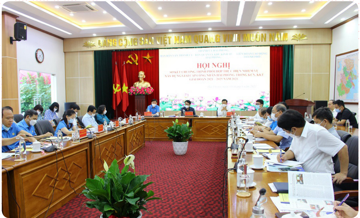
Hội nghị sơ kết Chương trình phối hợp thực hiện nhiệm vụ xây dựng giai cấp công nhân Hải Phòng trong khu công nghiệp, khu kinh tế (giai đoạn 2021 - 2025) năm 2021