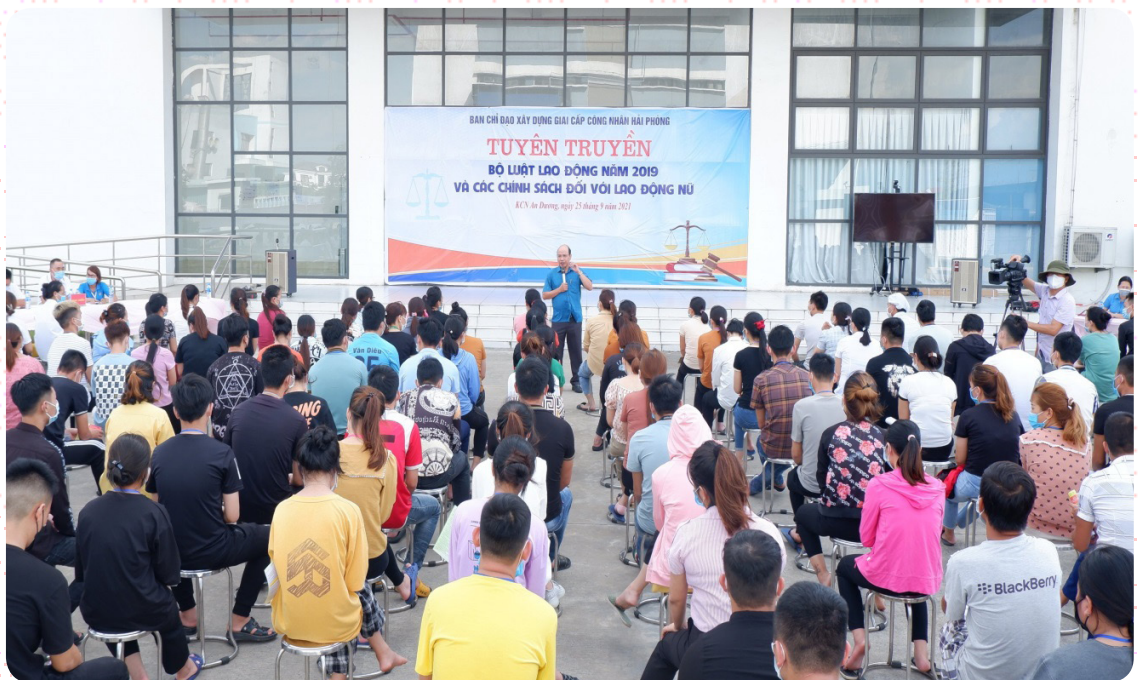
Ban Chỉ đạo Xây dựng giai cấp công nhân thành phố Hải Phòng tổ chức tuyên truyền Bộ Luật Lao động năm 2019 và các chính sách đối với lao động nữ tại Công ty TNHH Horn (Việt Nam)